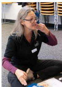
Son ADN : la formation

Pour le week-end de réflexion et de travail interne nous nous sommes réunis les 14 et 15 juin à Wünnewil FR. Nos enfants sont « chez eux » dans les locaux des éclaireuses et éclaireurs catholiques avec jeux, code, théâtre et activités en cuisine.