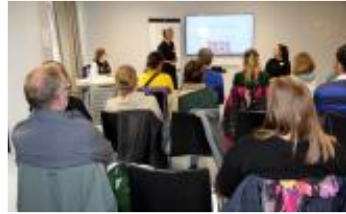
Ateliers LaPC pour adultes au congrès