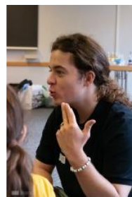
Atelier pour enfants « je code ainsi »

C'est le plus jeune groupe de l'ALPC, notre Team LaPC, qui a pu dignement fêter le 25 e anniversaire de notre belle Fondation A Capella. En effet, pile le 20 juin nous étions à l'assemblée des délégués de la faïtière de notre Fondation : Sonos. On nous a accordé un temps de parole pour parler de la Fondation, de l'ALPC et de la LaPC. Meilleurs vœux à cette occasion à notre Fondation. Merci à Sonos