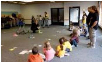
Le [kodo.poli] ® pour petits ... parlerre !

Les témoignages et contacts furent précieux pour les parents intéressés de toute la Suisse. Merci à toutes et tous.